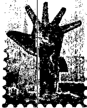
las Ciencias Sociales.

La UDISHAL tiene como símbolo distintivo una de las esculturas erigidas en el Memorial da América Latina , en São Paulo, Brasil, diseñada por Oscar Niemeyer. Ella es una mano de concreto armado, de siete metros de altura, con los dedos abiertos, en un gesto de desesperación. En la palma, un mapa esquematizado de América Latina, de color rojo, representa la sangre y los sufrimientos de la región y, según el propio Niemeyer, los "negros tiempos que el Memorial registra con su mensaje de esperanza y solidaridad".